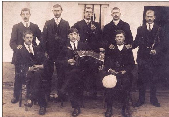
De acht zonen

Carolus (Charel) trouwde op 23 04 1881 met Rozalia Pryck en bleef wel in Begijnendijk wonen. Ook hij had een kroostrijk gezin: 12 kinderen waarvan 8 dochters en 4 zonen.